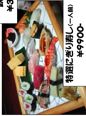
特選のにぎり寿し(1人前)