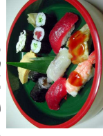
干鰯巻やみ物入り