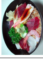
才口の上ヒネタを散りばめた八ツちらし