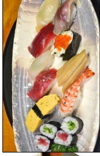
ネタが良く種類も多めの1人前