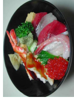
海鮮丼風の生ちらし