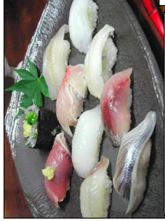
特選川魚 港直送海ネタ 10貫盛